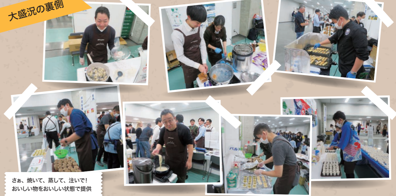
さあ、焼いて、蒸して、注いで! おいしい物をおいしい状態で提供

準備から実施まで各メーカーさんのご苦勞が感じられました。気になっていた商品など、実際に味わえたことがいい体験でした。今後も購買することで応援したいと思います。